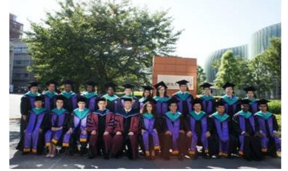
حفل التخرج بـ GRIPS

برنامج IISEE التدريبي يقام بالمشاركه مع وكالة التعاون الدولي اليابانيه الجايكا (JICA). المتقدمين للدورات عليهم التقدم للدورات من خلال برنامج الجايكا (JICA) كجزء من المساعدات اليابانيه التنمويه الرسميه. تكاليف تدريبك و اعاشتك يتم تقديمها لك بواسطة IISEE/BRI و JICA .