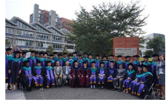
Cérémonie de remise des diplômes à GRIPS

Le programme de formation de l'IISEE est organisé en collaboration avec L'Agence Japonaise de Coopération Internationale (JICA). Les candidats doivent s'inscrire aux cours dans le cadre du programme de formation et de dialogue JICA mis au point dans le cadre de l'aide publique au développement du Japon. Le coût de la formation et de la vie est assurée par IISEE / BRI et la JICA.