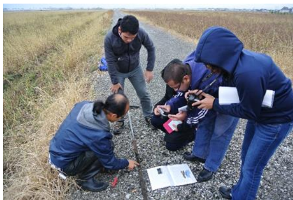
Visita de estudio

Formulario de solicitud se entrega por la oficina de JICA en su país. Para más detalles, por favor visita a nuestro sitio web* o contáctese a la oficina de JICA o la Embajada del Japón en su país.* http://iisee.kenken.go.jp/?p=faq#q4