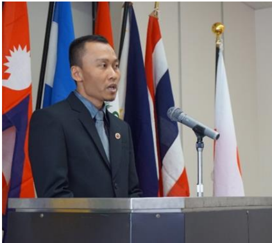
Ceremonia de Clausura