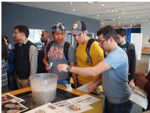
Visita de estudio