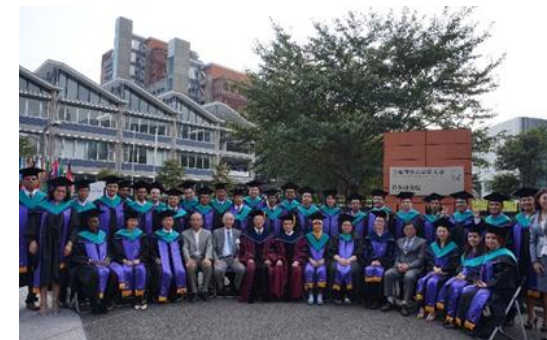
Ceremonia de Graduación en GRIPS

Programa de capacitación de IISEE se realiza en colaboración con la Agencia de Cooperación Internacional del Japón (JICA). Los solicitantes deben aplicar para los cursos a través de programas de capacitación y diálogo de la JICA como parte de la Asistencia Oficial para el Desarrollo del Japón. El costo de la capacitación y la vida corre a cargo de IISEE / BRI y JICA.