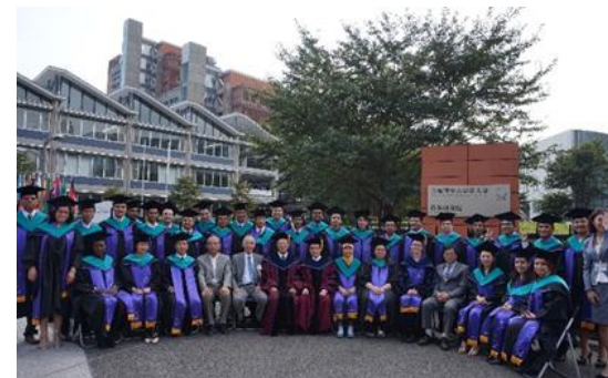
学位授与式（政策研究大学院大学）

国际地震工学的研修，是和国际合作组织（JICA）一起合作实行的。为了日本政府开发援助相关的JICA研修员接收事业而征集研修生。